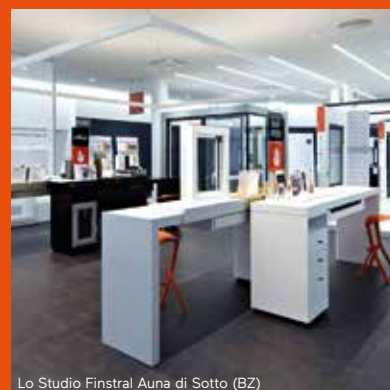
Lo Studio Finstral Auna di Sotto (BZ)

T +39 06 87071767 roma@finstral.com www.finstral.com/roma